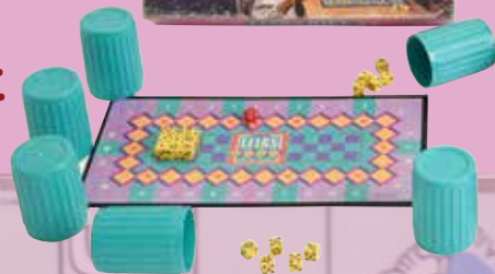
ライアーズ・ダイス